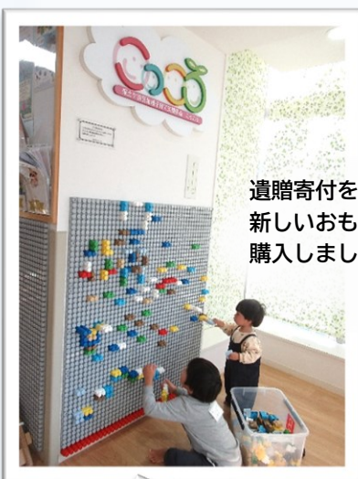
遺贈寄付を受けて 新しいおもちゃを 購入しました。

4月より月1回ひろばの一角を利用して、「Kinder DAY」が始まります。 身体を動かして遊ぶ遊具や、プラレール、ブロックなどを 設置しますのでぜひ遊びにきてね！