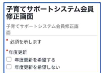
③年度更新の希望を選択し登録