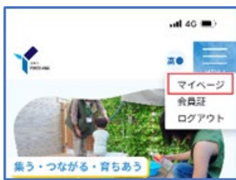
①ログイン後、マイページへ

横浜市地域子育て支援拠点ウェブサイト（以下、ウェブサイト）にて、更新手続きをしてください。